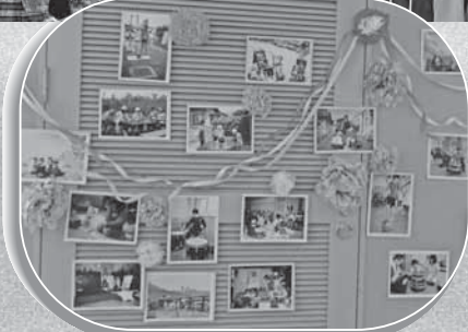
懐かしい写真たち… みんな、若ーい！！