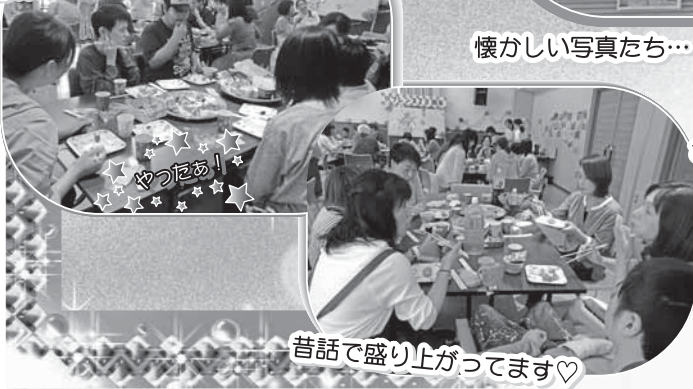
昔話で盛り上がってます♡