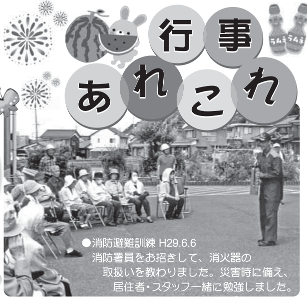
●消防避難訓練 H29.6.6 消防署員をお招きして、消火器の 取扱いを教わりました。災害時に備え、 居住者・スタッフ一緒に勉強しました。