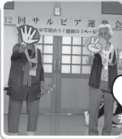
じゃんけんゲーム