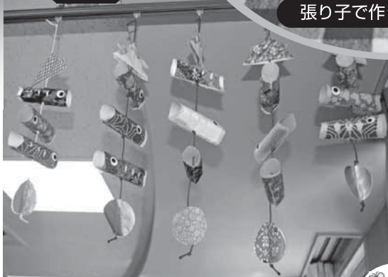
鯉のぼりの吊るし飾り